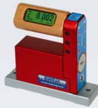
BlueLEVEL with horizontal base

BlueSYSTEM BlueLEVEL - BlueMETER with or without wireless data transmission mit und ohne Datenübertragung per Funk