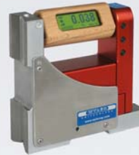
BlueLEVEL mit Winkelbasis