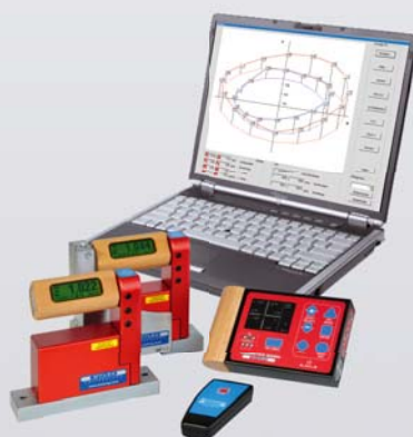
BlueLEVELs with BlueMETER SIGMA and Laptop with measuring software