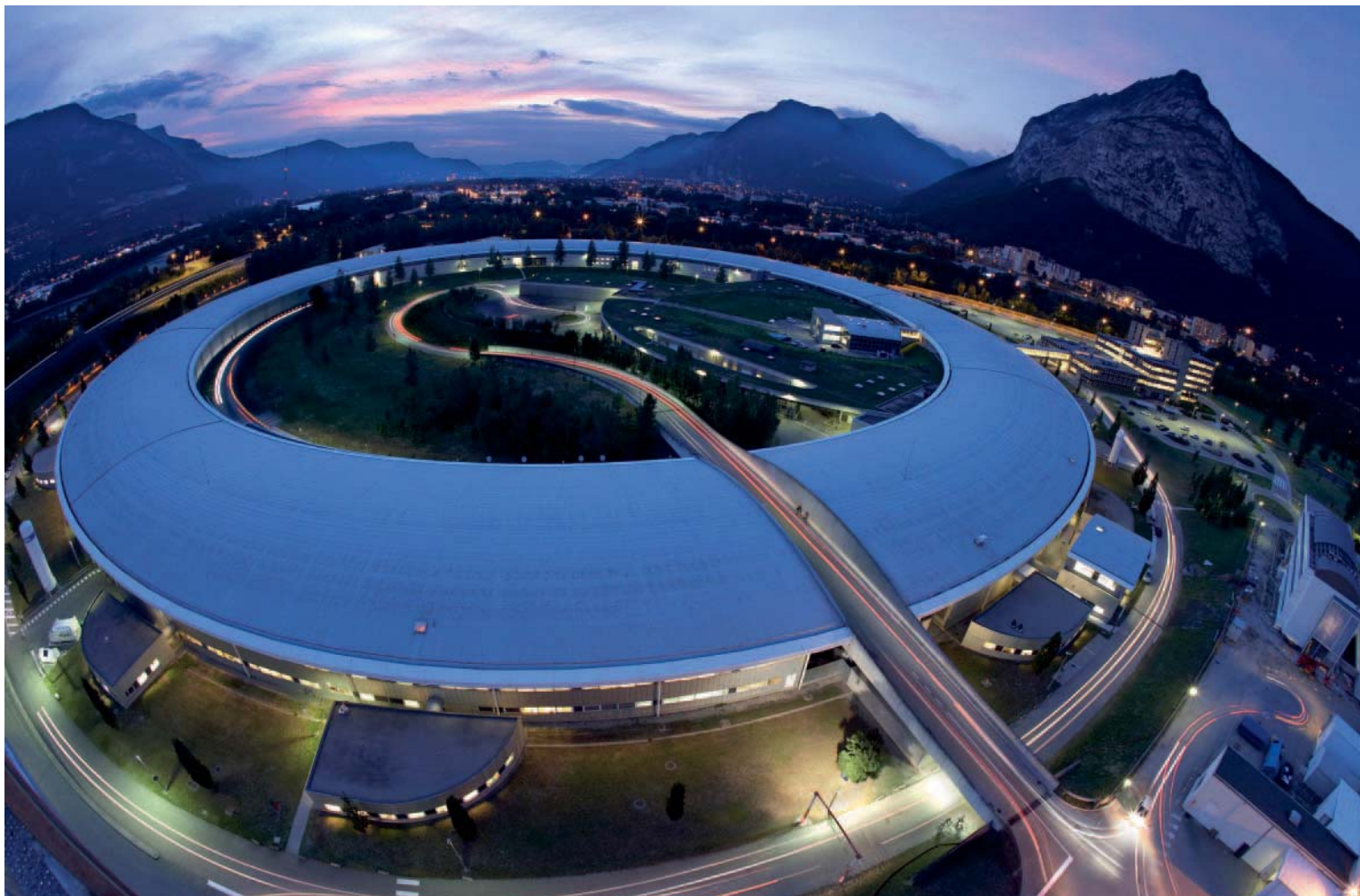
European Synchrotron Radiation Facility (ESRF)

vivantes. « À l'ESRF, nos hexapodes sont utilisés pour orienter des miroirs et des échantillons dans des positions particulières que leur excellente stabilité leur permet de maintenir dans le temps », explique Olivier Lapierre.