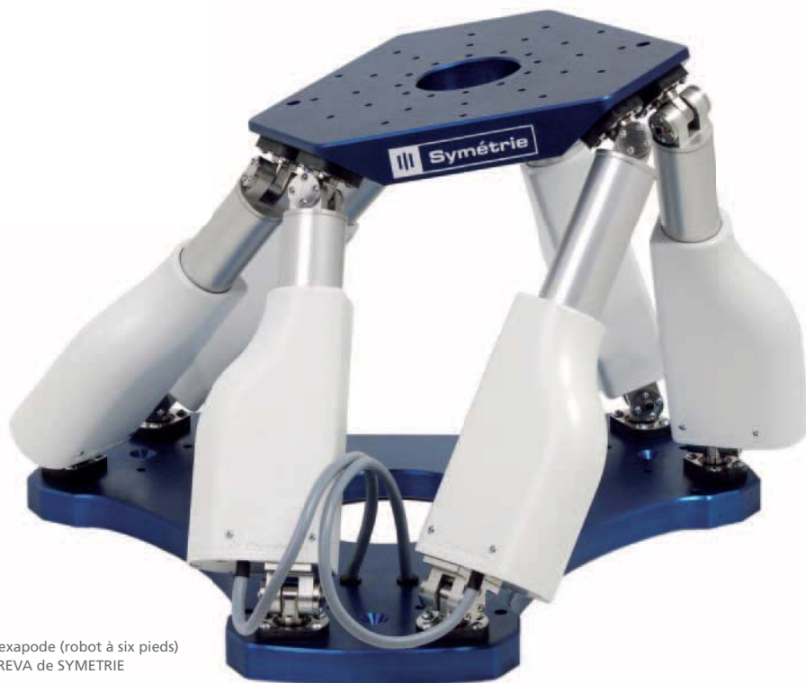
Hexapode (robot à six pieds) BREVA de SYMETRIE

Positionnement exact pour l'astronomie et la recherche moléculaire. Pourquoi fait-il beaucoup plus chaud à un million de kilomètres du soleil que sur sa surface ? Cette question d'astronomie, qui peut paraître simple, ne connaît aujourd'hui toujours pas de réponse définitive. Deux satellites qui seront placés en orbite en 2017 dans une formation d'une précision de l'ordre du millimètre devraient contribuer à résoudre ce mystère. L'un couvrira le soleil pour que l'autre puisse observer tranquillement la couronne solaire. Pour installer les instruments de mesure impliqués dans cette incroyable œuvre de précision, les techniciens de l'European Space Agency (ESA) utilisent un hexapode. Produit par SYMETRIE, société de haute technologie basée dans le sud de la France, l'hexapode est actionné par des moteurs FAULHABER.