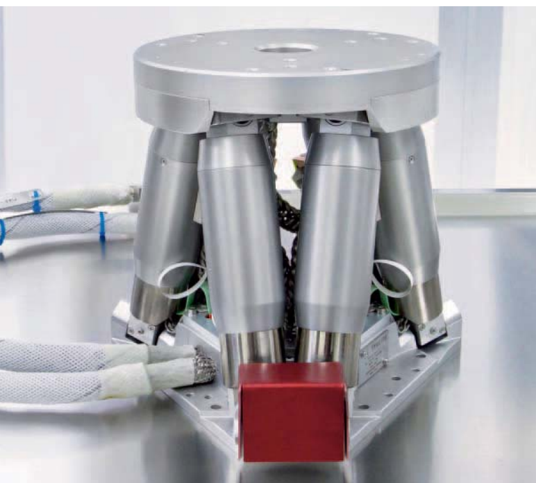
BORA en modèle compatible vide

Toutefois, à l'origine, l'hexapode BORA utilisé pour le projet GAIA n'a pas été développé pour l'astronomie mais pour l'observation d'objets extrêmement petits. Il a été conçu pour répondre à un besoin spécifique du synchrotron européen (ESRF) à Grenoble en France. À la porte des Alpes françaises, le synchrotron accélère des électrons jusqu'à une vitesse proche de celle de la lumière, provoque leur collision et génère les rayons X les plus intenses au monde. Sa puissance est environ dix mille fois supérieure à celle des rayons X émis par un appareil médical et, pourtant, il est aussi fin qu'un cheveu. Ce rayonnement sert à analyser toutes sortes d'échantillons et de matériaux, des structures de cristaux semi-conducteurs aux mouvements moléculaires dans les cellules